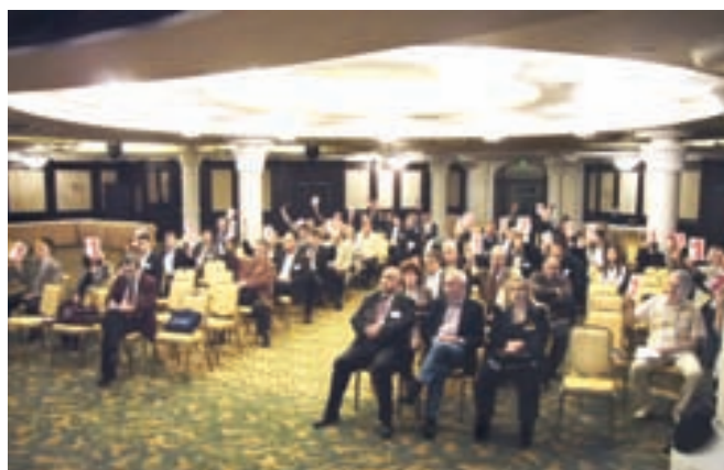
Делегатите гласуват за представител в Законодателния съвет