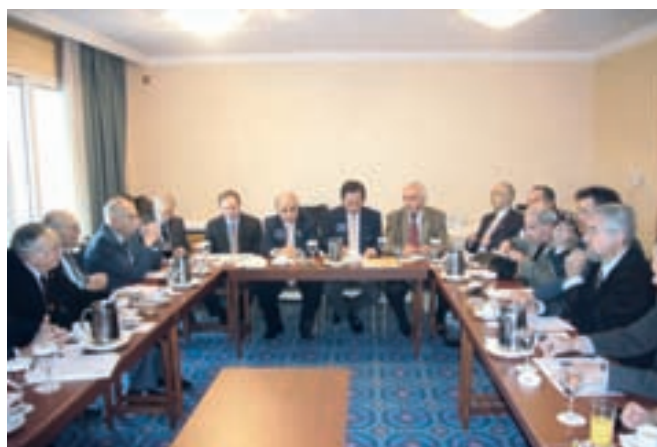
Срещата в Атина с президента на Ротари Интернешънъл Д.К. Лий