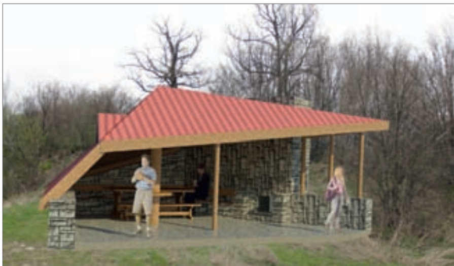
План на заслона