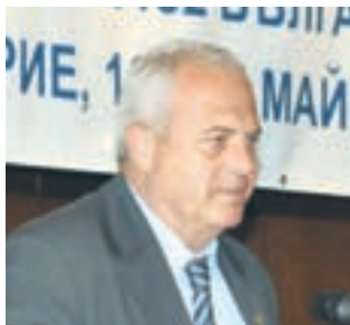
Кметът Петър Златанов