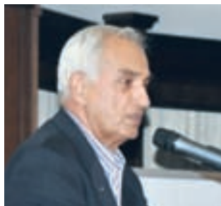
ПДГ Калчо Хинов