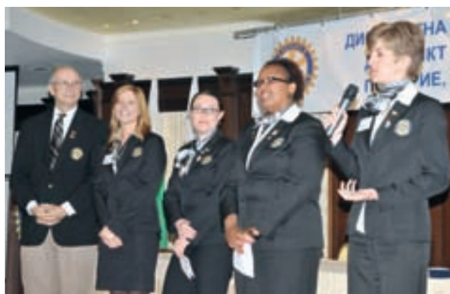
Участниците в Груповия образователен обмен